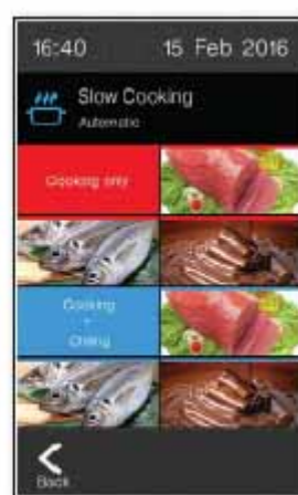
Cocción lenta / Mantenimiento a temperatura