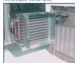
unidad cond. extraíble removable cond. unit