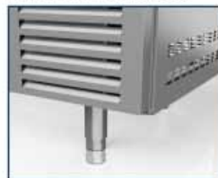
patas regulables de 135-210 mm 135-210 mm adjustable leg