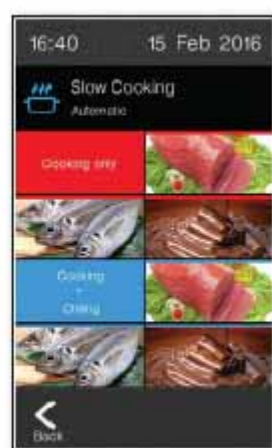
Cocción lenta / Mantenimiento a temperatura