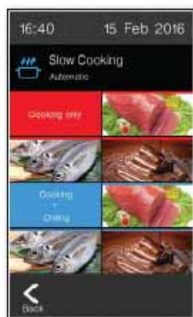
Cocción lenta / Mantenimiento a temperatura