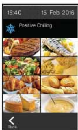
Abatimiento Positivo +90 / +3°C