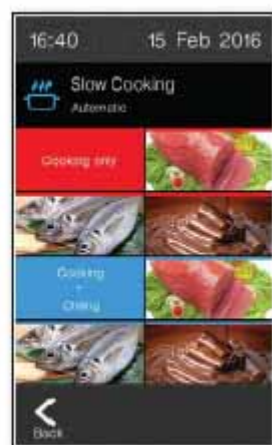
Cocción lenta / Mantenimiento a temperatura