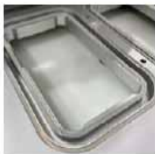
MOLDE ADICIONAL DISEÑO A MEDIDA Para formatos especiales.