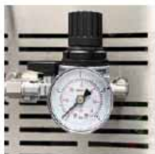
INYECCIÓN DE GAS Instalación para inyección de gas inerte en bolsa.