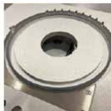
MOLDE FIJO Con corte perimetral de una bandeja.