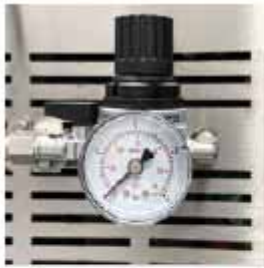
INYECCIÓN DE GAS Instalación para inyección de gas inerte en bolsa.