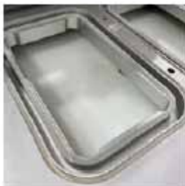
MOLDE ADICIONAL DISEÑO A MEDIDA Para formatos especiales.