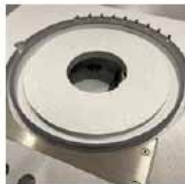
MOLDE FIJO Con corte perimetral de una bandeja.