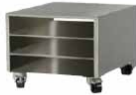
MESA INOX 570 x 480 x 670 Mesa universal inox con ruedas.