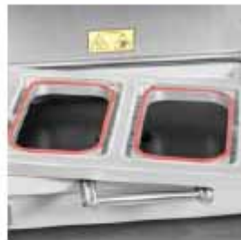
MOLDE ADICIONAL Con diseño gastronorm.