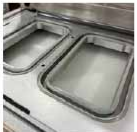
MOLDE FIJO Con corte perimetral de dos bandejas