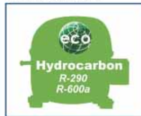
hidrocarburo de serie standard hydrocarbon