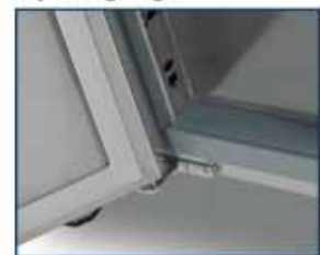
bisagras cierre automático self closing hinges