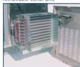
unidad cond. extraíble removable cond. unit