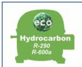
hidrocarburo de serie standard hydrocarbon