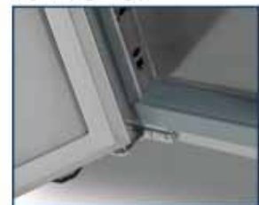
bisagras cierre automático self closing hinges