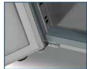
bisagras cierre automático self closing hinges