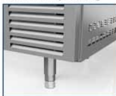
patas regulables de 135-210 mm 135-210 mm adjustable leg