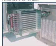
desagüe limpieza cleaning drainage