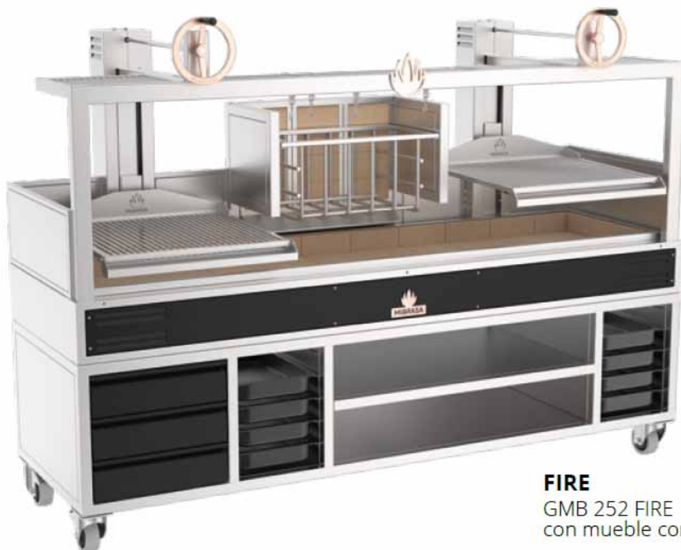
FIRE GMB 252 FIRE con mueble completo