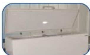
Incluye luz interna LED, que funciona al abrir la puerta.