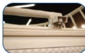
Incluye cerradura con llave y termostato.