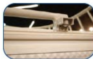
Incluye cerradura con llave y termostato.