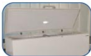
Incluye luz interna LED, que funciona al abrir la puerta.