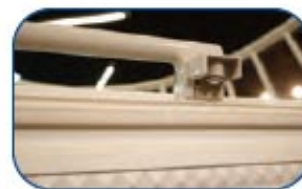
Incluye cerradura con llave y termostato.