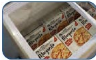
Ideales para la visualización de alimentos congelados.