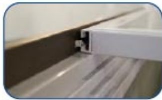
Se reduce las pérdidas térmicas con el exterior.