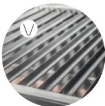
V shape grill Parilla en V Grille en V